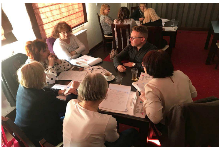
Uczestnicy seminarium - KSDEZ